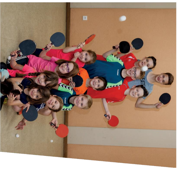
Stand: Dezember 2019, Fotos: DTTB Gestaltung: angrafik GmbH, Seligenstadt